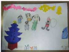
サンタさん来年も来てね！

12月11日(日)には、女性部の皆さんと、八幡学園で餅つきを行ってきました。昭和63年から続いている行事です。みんなで良いお正月を迎えましょう！！