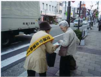
(交通安全キャンペーン啓発物配布の様子)

盆栽教室も今年で13回目を数えます。初期の頃の作品を大切に育てておられる人も、暑い夏に一部が枯れてしまった人も、きれいな緑の苔で鉢が覆われると、気分も一新し、初春にふさわしい鉢が出来上がりました。