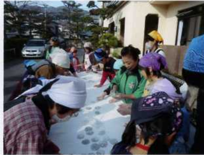
(八幡学園餅つきの様子)

広島西警察署管内でも佐伯区の死亡事故は多いようです。部員も啓発物を手渡ししながら、“気をつけて下さいネ”と声に力が入ります。