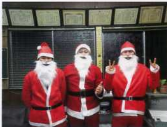
はるばる北欧から！